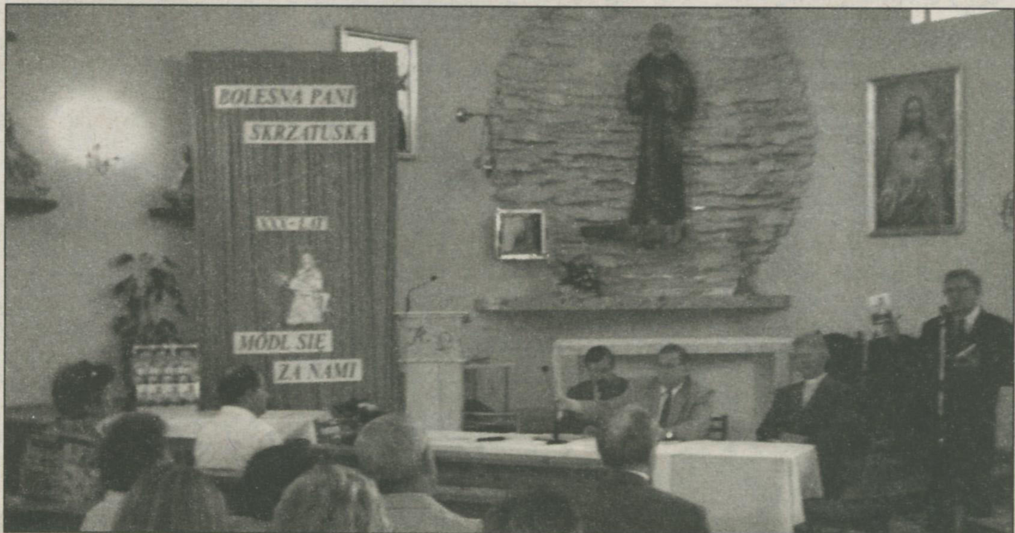
Spotkanie odbyło się w kaplicy św. M. Kolbego.

W książce autor zawarł wiele nieznanych kart skrzatuskiego sanktuarium.